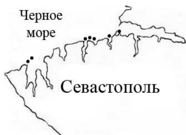
Рисунок 1. Районы вылова A. hepsetus